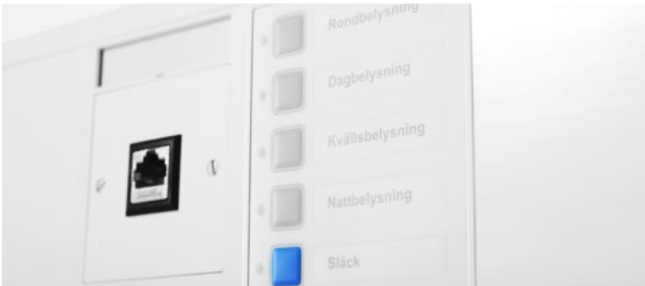
Olika uttag kan monteras utan utstickande ram för enklare rengöring.

Att installera ett stort antal paneler i sjukhus kan ta mycket tid. Därför har vi utvecklat ett snabbt och enkelt sätt att montera Aluflex 16. Först skruvas konsoler upp och sedan hängs vårdrumspanelen på och låses via en självborrande skruv i var ände.