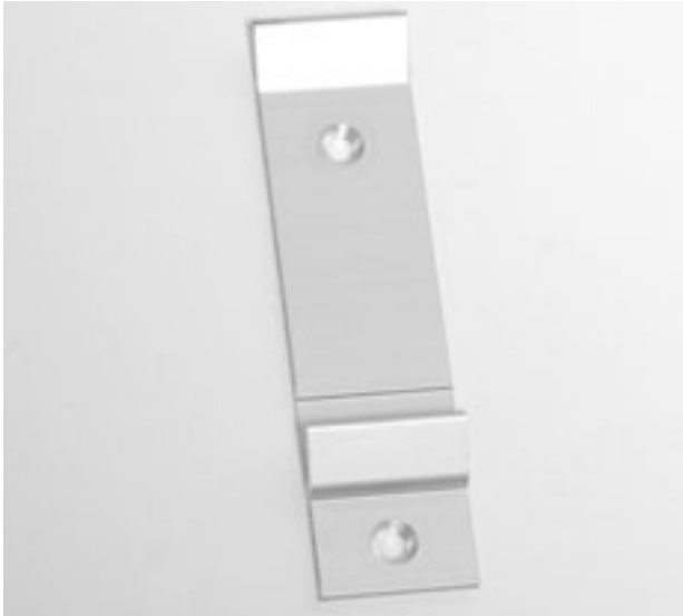
Konsol för uppfästning.