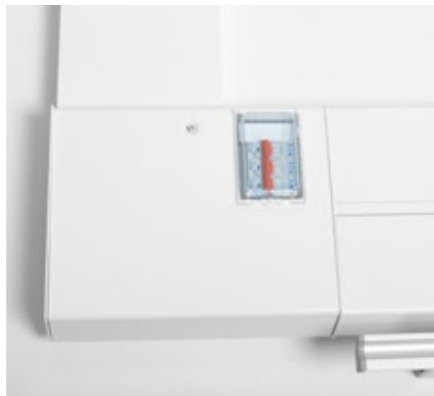
Anslutningsbox för elanslutning.

Aluflex 16 består av en aluminiumprofil med två kanaler och lätt sluttande ovansida. Den har enbart släta ytor vilket möjliggör en enkel renhållning och kan på så sätt möta de höga krav på god hygien som sjukhusmiljöer har.