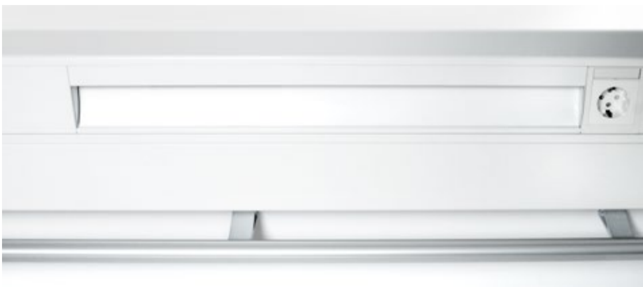
Läs- och undersökningslampa med LED.