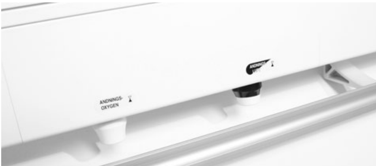
Gasuttag monterat nedåt för slanganslutning.